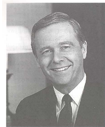
Pete Wilson 주지사

1991년, 전 San Diego 시장이자 상원의원이던 새로운 공화당 주지사 Pete Wilson 이 Deukmejian 에 이어 주지사가 되었다. Wilson 은 캘리포니아가 심한 경제 침체를 겪는 것을 지켜 보았다. 냉전 시대의 제조업에서 하이 테크 경제로의 전이는 아직 캘리포니아에 일어나지 않고 있었고, 따라서, 새 주지사는 전임자들과 마찬가지로 기존 복지 지원을 명령 받은 예산을 물려 받았다. 그러나, 비용이 많이 드는 정신 건강 체계는, 사실 의료 업자들이 치료하기를 거부하는 경우들을 처리해 주어야만 했다.