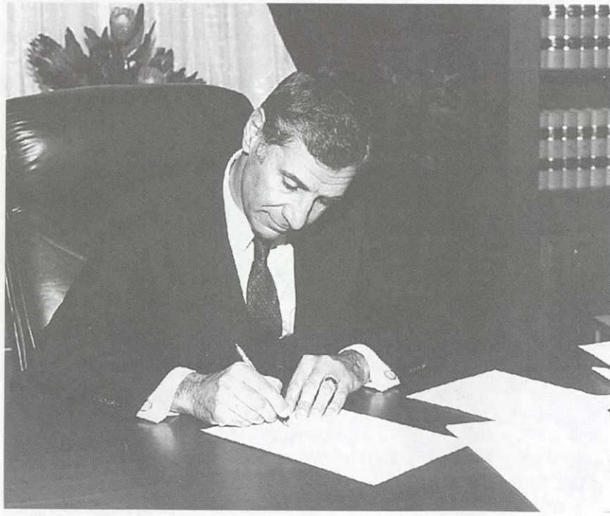
George Deukmejian 주지사가 법안에 서명하고 있다.

캘리포니아의 증가하는 살인율은 멈출 수가 없는 것처럼 보였다. 지역 신문과 TV 리포터들은 평균 도시인들이 자동차 사고로 보다 칼이나 총에 의해 죽을 확률이 더 높다고 주장했다. 많은 도시내 살인 사건들이 갱단에 관련되게 되었다. 복장 규정, 별명, 손 신호, 그리고 무서울 정도의 무기를 갖춘 이들 젊은 갱단들은 실제적인 반문화 (counterculture)를 이루고 있었다. 경쟁하는 갱단들 사이의 라이벌 관계 때문에 치명적인 “운전하면서 총 쏘는 것(drive-by)”과 같은 총질과, 무고한 방관자들이 종종 살해되는 자멸적인 거리 전쟁이 계속 발생했다. 몇몇 “갱단 관련” 살인들은 영역 때문에, 또는 잘못된 마약 거래 때문에 일어났다. 높은 실업율과 가족의 해체, 또한, 빈번하게 도시 범죄의 증가와 연결되어 지곤 한다. 방향 감각을 잃은 젊은이들은 그들이 가정이나 학교에서 얻지 못한 지원을 얻기 위해 갱단에 가입했고, 그 결과, 강간, 가중 폭행, 절도, 그리고 강도 범죄가 전염병의 수준에 달하게 되었다.