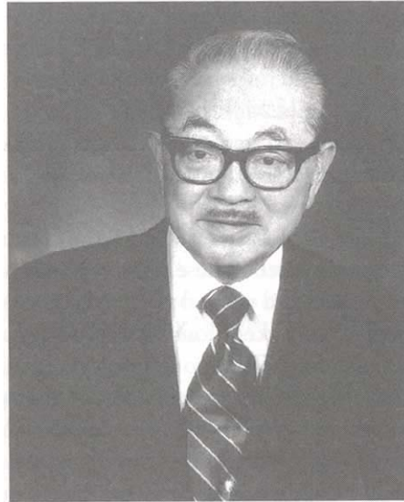
Sam I. Hayakawa 상원의원, 1977 년.

Brown 에게서 주지사직을 계승한 Ronald Reagan 은 강한 어조로 캠퍼스 극단주의를 “청소” (clean up) 할 필요를 말했다. San Francisco State College 의 강력한 총장이 그의 동맹이 되어주었다. 존경받는 어의론 학자 (semanticist)이기도 했던 S.I. Hayakawa 총장은 반항적인 학생들과 대치하기를 주저하지 않았고, 그는 후에 용기를 높이 산 캘리포니아 유권자들에 의해 미 상원의원에 선출되는 보상을 받았다.