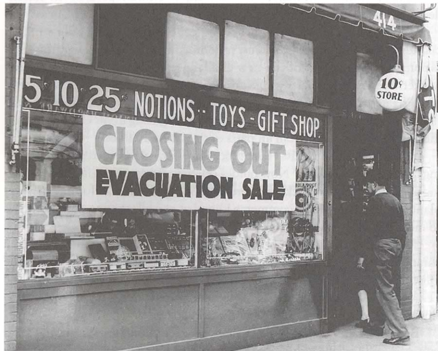
1942 년 San Francisco 의 싸구려 잡화점 Okano Bros.의 피난 세일

이들 무고한 사람들을 억류하려는 움직임은 캘리포니아의 검찰총장이던 Earl Warren 의 주장 때문이었다. 당시 주지사 선거에 출마한 그는 State Grange, American Legion, Native Sons and Daughters of the Golden West, 그리고 State Federation of Labor 같은 원주민 보호주의 그룹들의 영향을 받았다. 선거에서 그의 상대인 Culbert Olson 주지사 또한 배척주의자들인 California Joint Immigration Committee 에 주의를 기울이고 있었다.