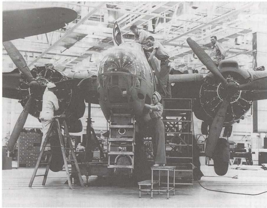
Assembly-line workers of both sexes contribute to the production of an A-20 attack bomber at the Douglas Aircraft plant in Long Beach, California, 1943.

1943 년 캘리포니아주 Long Beach 에 있는 Douglas 비행기 공장에서 남녀 노동자들이 함께 A-20 공격형 폭격기를 제작하고 있다.