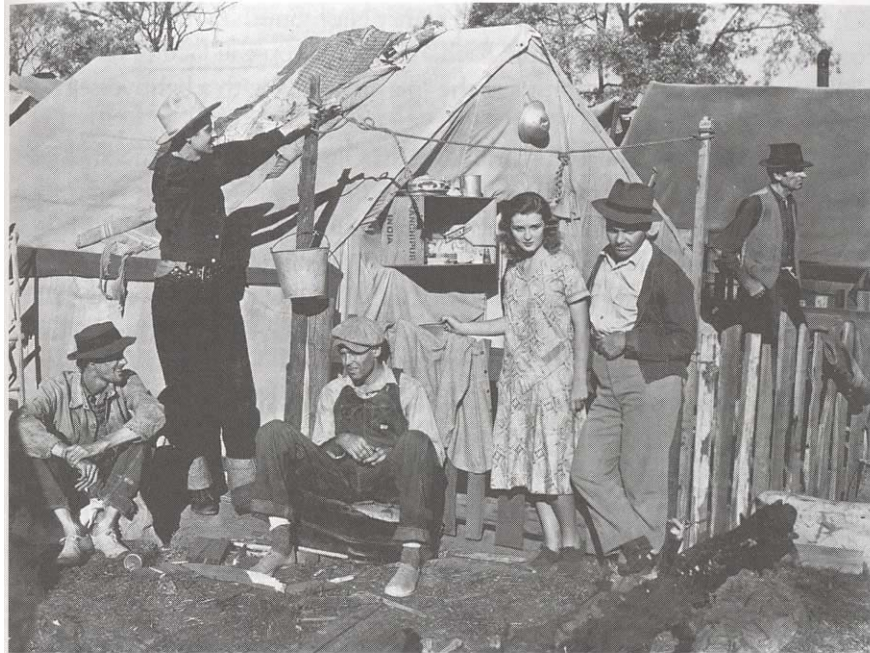
John Steinbeck's classic novel, The Grapes of Wrath, was made into a highly successful movie in 1940, directed by John Ford and starring James Stewart (center).

John Steinbeck 의 고전 “분노의 포도”는 1940 년에 대단히 성공적인 영화로 만들어졌다. John Ford 가 감독하고 James Stewart (사진의 중앙)이 출연 했음.