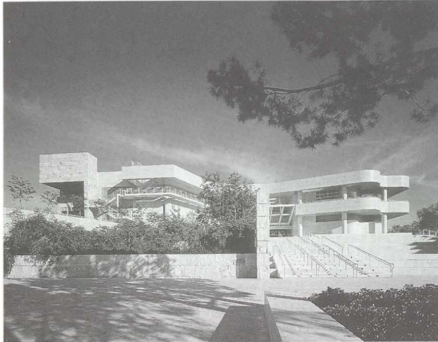
J. Paul Getty Museum at Getty Center.