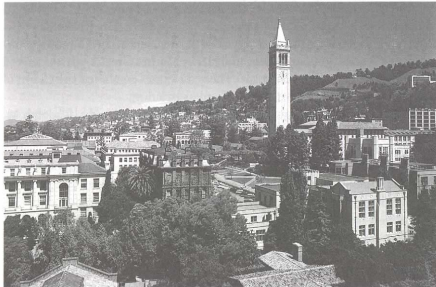
University of California, Berkeley, central campus dominated by its "campanile."

캘리포니아 대학들 설립시에 다양한 형태의 건축 양식들이 나타났다. 완전히 새로운 캠퍼스 플랜을 요구한 이들 대학들중의 첫 케이스는 Los Angeles의 State Normal School이었고, 그 학교는 나중에 Westwood의 University of California at Los Angeles, 즉 UCLA가 됐다. 주의회는 새로운 주립대학 캠퍼스들뿐 아니라 다른 UC 캠퍼스들도 건설했다.