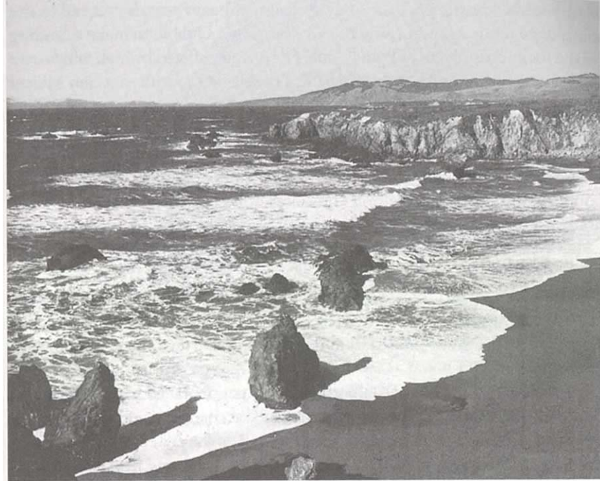
Ragged stretch along the northern coast of California first explored by Cabrillo.

카브리요가 처음으로 탐험한 캘리포니아의 북부 해안을 따라 펼쳐져 있는 들쭉날쭉한 지형.