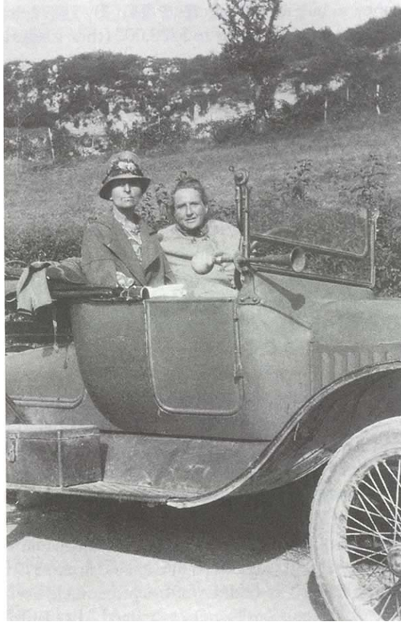
Gertrude Stein (오른쪽)과 Alice B. Toklas. 낱짜 미상.

1899 년, Mary Austin 은 가족과 함께 일리노이에서 서부로 와서, Owens Valley 에서 학생들을 가르치며, 여가시간에 이야기와 Charles Lummis 의 잡지들에 기사들, 그리고 그녀의 가장 잘 알려진 책 The Land of Little Rain (1902)를 썼다. 그 책에서 그녀는 원주민들, 동물들, 그리고 Yosemite 남쪽과 Death Valley 북쪽의 경치를 묘사했다. 그녀는 Basket of Woman (1904), The Flock (1906), 그리고 California, Land of the Sun (1914)에서, 보기에는 황량한 야생 쉼 (sagebrush)과 모래에 대한 감사의 느낌을 계속 상기시켰다.