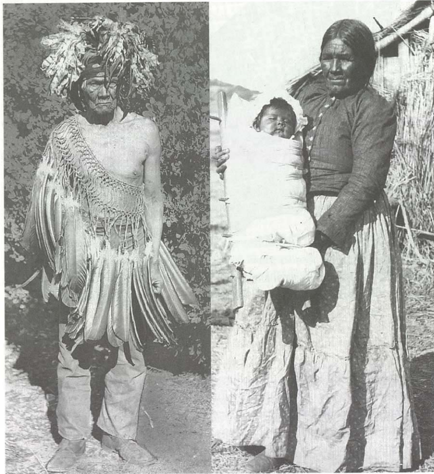
1906 년 (Sand Diego 북동쪽의) Mesa Grande 에서의 디에게노 (Diegueno) 부족

Members of the Diegueno tribe, Mesa Grande, 1906.