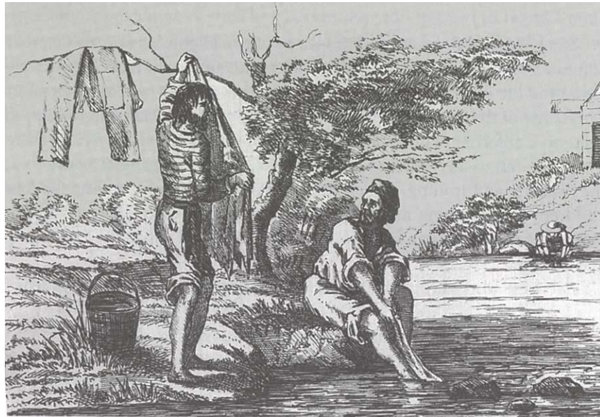
1848-49 광산촌에서의 각종 여가 보내기

하지만, 금 때문에 발생한 호경기 때문에 북부 캘리포니아에서의 소비자 물가는 동부 미국의 물가와 비교해 말도 안되게 높았다. 당시의 화폐는 오늘날의 달러보다 구매력이 훨씬 높았지만 San Francisco 에서 동부쪽의 신문 한부는 $1 에 팔렸다. 대서양쪽 동부에서는 4-5 센트인 빵 한덩어리는 50-75 센트, 켄터키 버번 위스키는 1 quart 당 $30 로 뛰었다. 사과 1 개에 $1-$5 이었고, 계란은 한 다스에 $50 (식당에서는 삶은 계란 하나에 자그마치 $5), 커피는 파운드당 $5 이었다. Sacramento 상인들은 푸줏간 칼 하나를 $30 에 팔았고, 담요는 $40, 장화는 한 켤레에 $100, 무명 텐트를 고정하기 위한 못은 파운드당 $192, 약은 한 알당 $100 이거나, 한 방울에 $1. Stockton 이나 Sacramento 에서 호텔 방은 한달에 자그마치 $1,000 이었는데, 이런 돈은 고향에서는 엄청난 금액이었다.